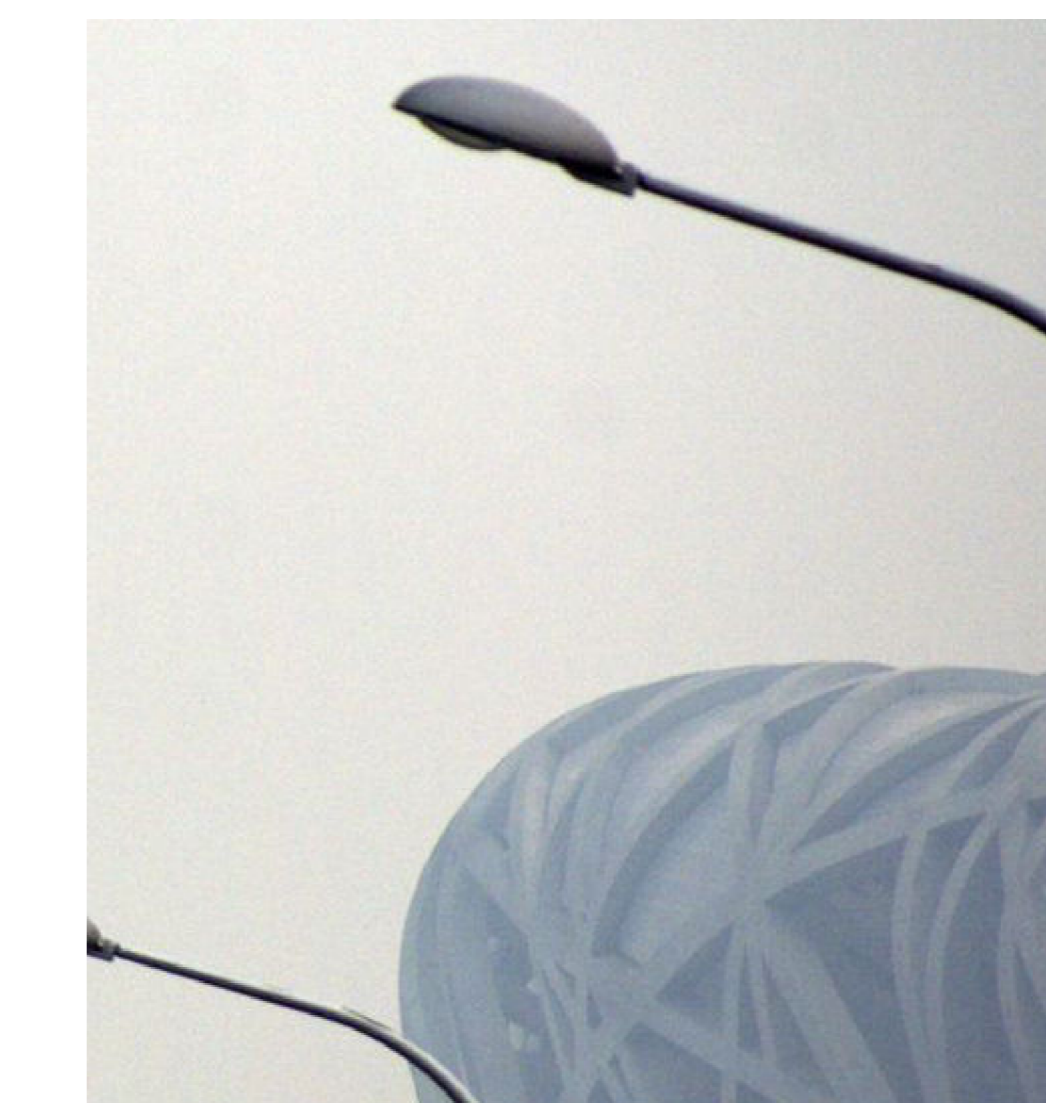
Lampione a Un Braccio