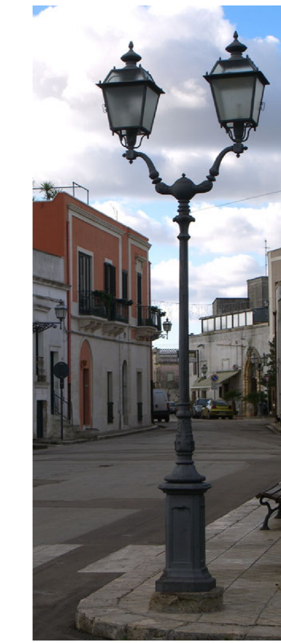
Lampione a Due Braccia