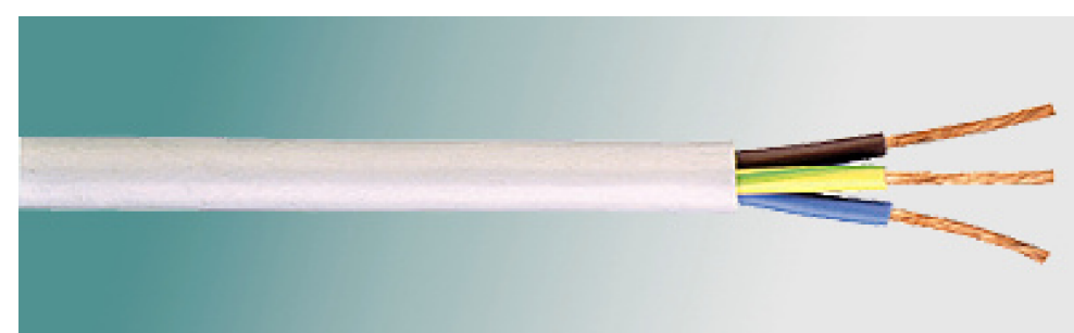
Cavi Bassa Tensione